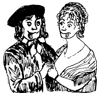
Das Ehrwürdige Paar ;-)