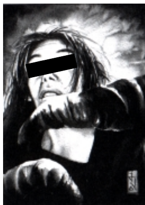
Alrik v. W. in Pa-