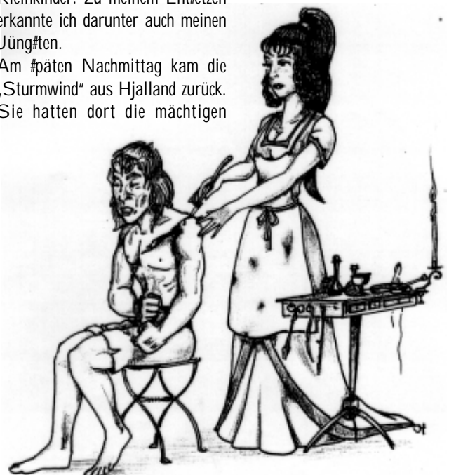
Die Verletzte hatte Glück, er hat nur einige Splitter abbekommen

Am späten Nachmittag kam die „Sturmwind“ aus Hjalld zurück. Sie hatten dort die mächtigen